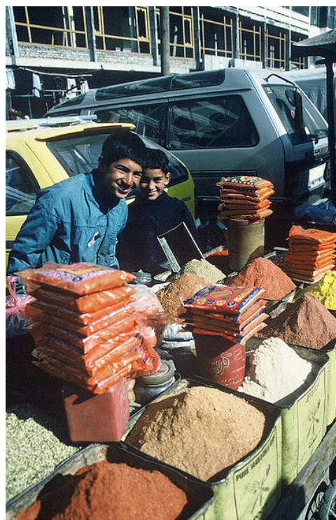
Kaksi poikaa myymässä mausteita torilla Afganistanissa.

Lipun heiluttaminen ei voi olla ainoa syy oleskeluumme Afganistanissa. Tämän takia kaipaamme asiasta avointa keskustelua myös Suomessa.