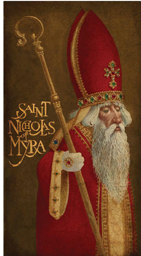
Kuva: Pyhä Nikolaos, ote tuntemattomaksi jääneen taiteilijan alttaritaulusta.

Nikolaoksen vaikutus näkyy aidossa ja oikeimmassa korvatunturin joulupukisamme esimerkiksi siinä, että hän on lainannut Nikolaokselta punaiseen pukeutumisen.